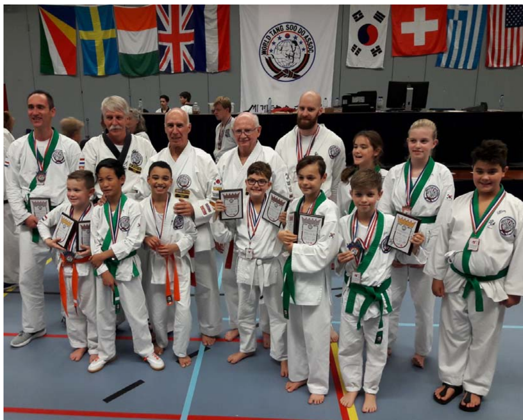
Alle deelnemers aan het EK van dojang Koguryo samen met beide grootmeesters en instructeur

Moogi Sul is een loopvorm met een wapen. Een loopvorm is een soort schijngevecht waarbij met voorgeschreven bewegingen "gevochten" wordt met denkbeeldige tegenstanders. Vanaf de bruine band mag je deelnemen aan dit onderdeel met een stok, vanaf 2 de dan (zwarte band) mag je deelnemen met een mes of zwaard.